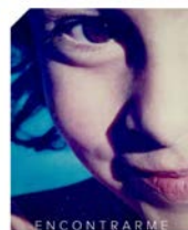
"Encontrame" by Juli AngelsARTE

Canción recomendada para un alumnado de 6 años en adelante. Con "Encontrame" podrás trabajar la tristeza, el miedo, la frustración, y la rabia. Así como el desarrollo del autoliderazgo, el autoconocimiento, y la tolerancia al estrés.