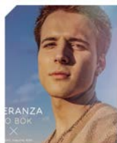
"Esperanza" by Teo Bok AngelsARTE

Crea tu perfil y entra a formar parte de una gran Comunidad de talento