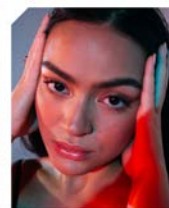
"En otra vida" by Riza AngelsARTE

Canción recomendada para un alumnado de 12 años en adelante. Con "En otra vida" podrás trabajar la tristeza, el miedo, la preocupación, y la resignación. Así como el desarrollo del autoconocimiento, el autoconocimiento y la tolerancia.